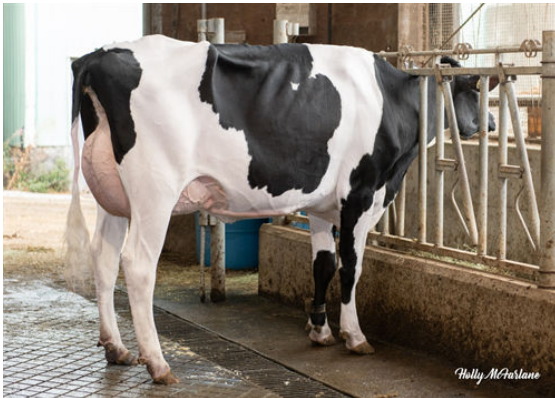
PROGENESIS ZAZZLE PRESTIGE DAM