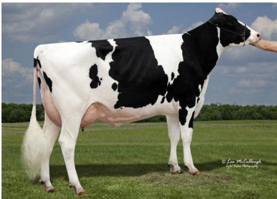
SYNERGY UNO POT O GOLD FIFTH DAM